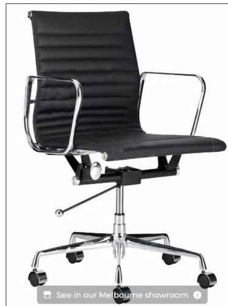
3.1. Дизајн столице са краћим наслоном