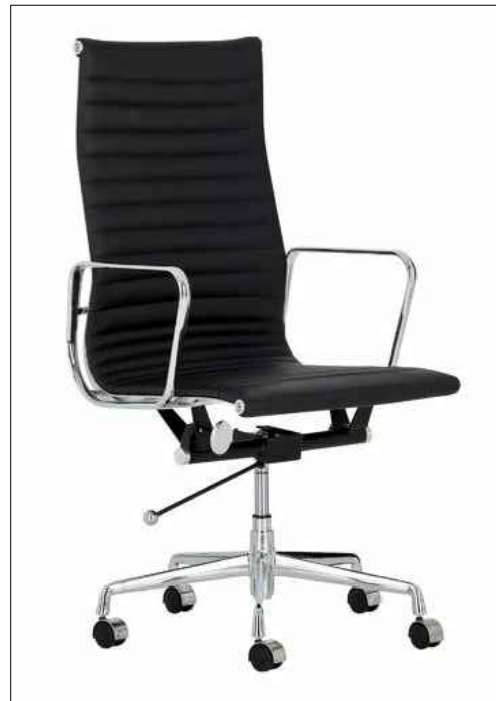
3.2. Дизајн столице са дужим наслоном