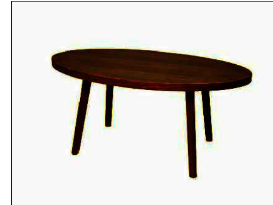
1.10. Клуб сточић пречника минимум 900мм, висине мин.550мм, од пресованог фурнира, у боји по избору инвеститора.