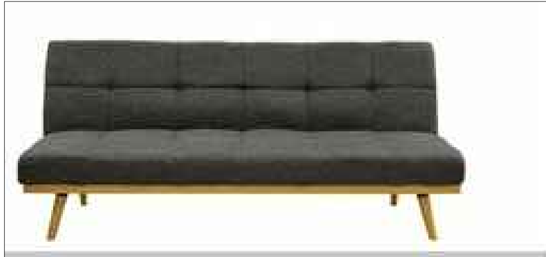
3.5. Дизајн софе и фотеље са ногама и текстилом у боји по избору пројектанта